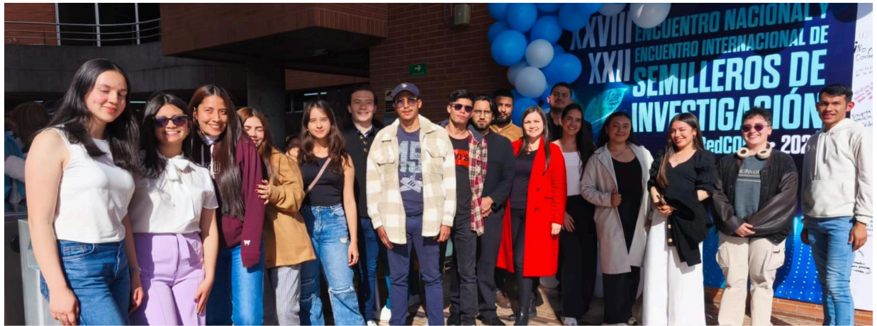
Estudiantes de la Universidad de Boyacá durante su participación en el XXVIII Encuentro Nacional y el XXII Encuentro Internacional de Semilleros de Investigación de la RedCOLSI, realizado en la Corporación Universitaria Minuto de Dios, sede Bogotá, en octubre de 2025, un espacio que fortalece la investigación formativa y la divulgación del conocimiento.