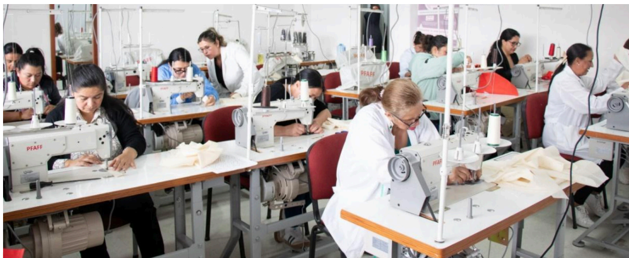
Madres comunitarias participan en el curso taller de confección básica en Tunja, una iniciativa que, además de fortalecer habilidades técnicas para el emprendimiento y la empleabilidad, fomenta redes de apoyo y nuevas oportunidades de generación de ingresos para sus hogares.

El siguiente paso se enfocará en la formulación de proyectos a partir de las priorizaciones identificadas, reafirmando la invitación a seguir construyendo juntos, con la certeza de que cuando la universidad escucha, aprende, y cuando la comunidad se organiza, transforma.