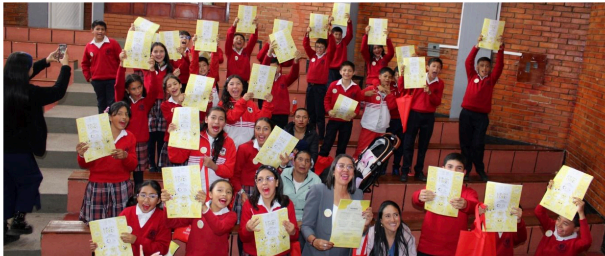
Estudiantes del Colegio INEM, reciben el periódico escolar "Exploradores", un proyecto desarrollado desde la asignatura de Diagramación que abrió espacios para que niños y niñas narraran su propia realidad, fortalecieran su confianza y se reconocieran como autores de sus historias.

Como respuesta directa a las necesidades identificadas, se implementó un curso-taller de confección básica dirigido a madres comunitarias y mujeres cabeza de familia de Tunja. Durante tres semanas de formación intensiva, asumidas por la universidad en materiales e insumos, las participantes adquirieron habilidades técnicas para el emprendimiento y la empleabilidad. Más allá del aprendizaje, la experiencia ha fomentado valiosas redes de apoyo entre mujeres de distintos barrios, contribuyendo al fortalecimiento de redes de