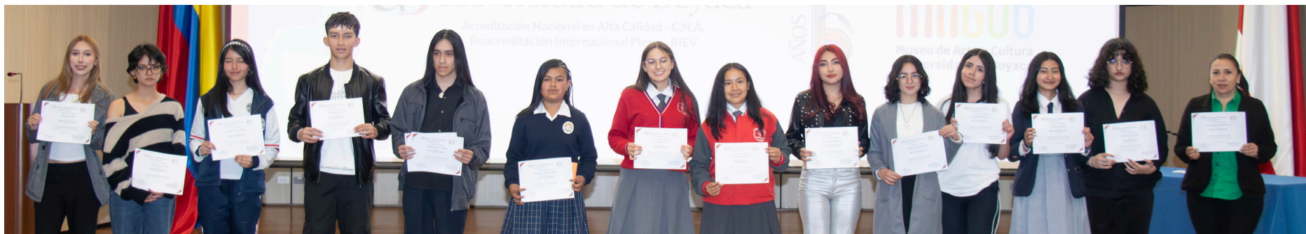
Estudiantes de distintos colegios de Colombia participan en la premiación y reconocimiento del Segundo Concurso de Pintura “Los jóvenes pintan su mundo” 2025, una iniciativa que reafirma el compromiso de la Universidad de Boyacá con la promoción del arte y la cultura como lenguajes fundamentales para la transformación social.