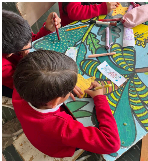
Estudiantes del Colegio INEM Carlos Arturo Torres plasman en un mapa las realidades de su barrio durante un ejercicio de cartografía social, convirtiéndose en protagonistas del macroyecto “Derechos para Todos”.