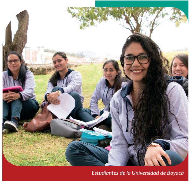
Estudiantes de la Universidad de Boyacá

De esta manera, la Universidad de Boyacá, continúa fortaleciendo su oferta académica y ajustándose a las necesidades del entorno, ofertando programas con calidad, en una menor duración y con la misma rigurosidad y excelencia académica.