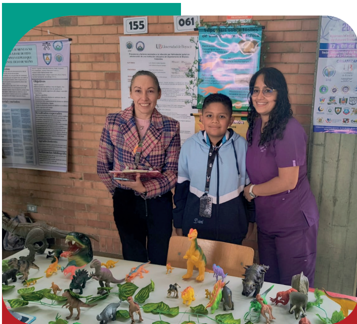
Participantes del Encuentro de Semilleros de Boyacá

brindó a jóvenes investigadores la oportunidad de socializar, evaluar y enriquecer sus proyectos.