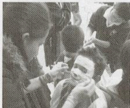
Taller de Máscaras, una de las actividades de Studium

En el marco del convenio de colaboración interinstitucional entre la Universidad de Boyacá y las instituciones de educación secundaria de la región, a través del programa STUDIUM se pretende fortalecer la formación de los jóvenes, mediante dos nuevos incentivos académicos y