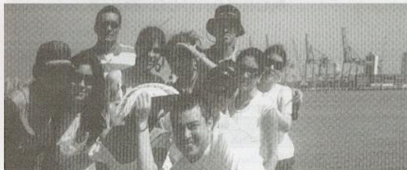
Estudiantes y docentes en el puerto de Buenaventura, durante salida académica

Durante el presente período los estudiantes de Administración y Negocios Internacionales se vincularon a importantes empresas nacionales e internacionales, con el objeto de realizar práctica profesional, entre ellas las siguientes: Zona Franca de La Candelaria en Cartagena, Colombia; Flint Group Consulting en Lima, Perú; Roldán S.I.A. Sociedad de Intermediación Aduanera; Interflex S.A y Hubemar S.I.A. Sociedad de Intermediación Aduanera en Bogotá, Colombia; Cámara Colombo China de Integración en Shanghai, China; International Center For Agribusiness Research And Education en Yereván, Armenia, antigua Unión Soviética, y Puerto de Manzanillo y Bancomext en México.