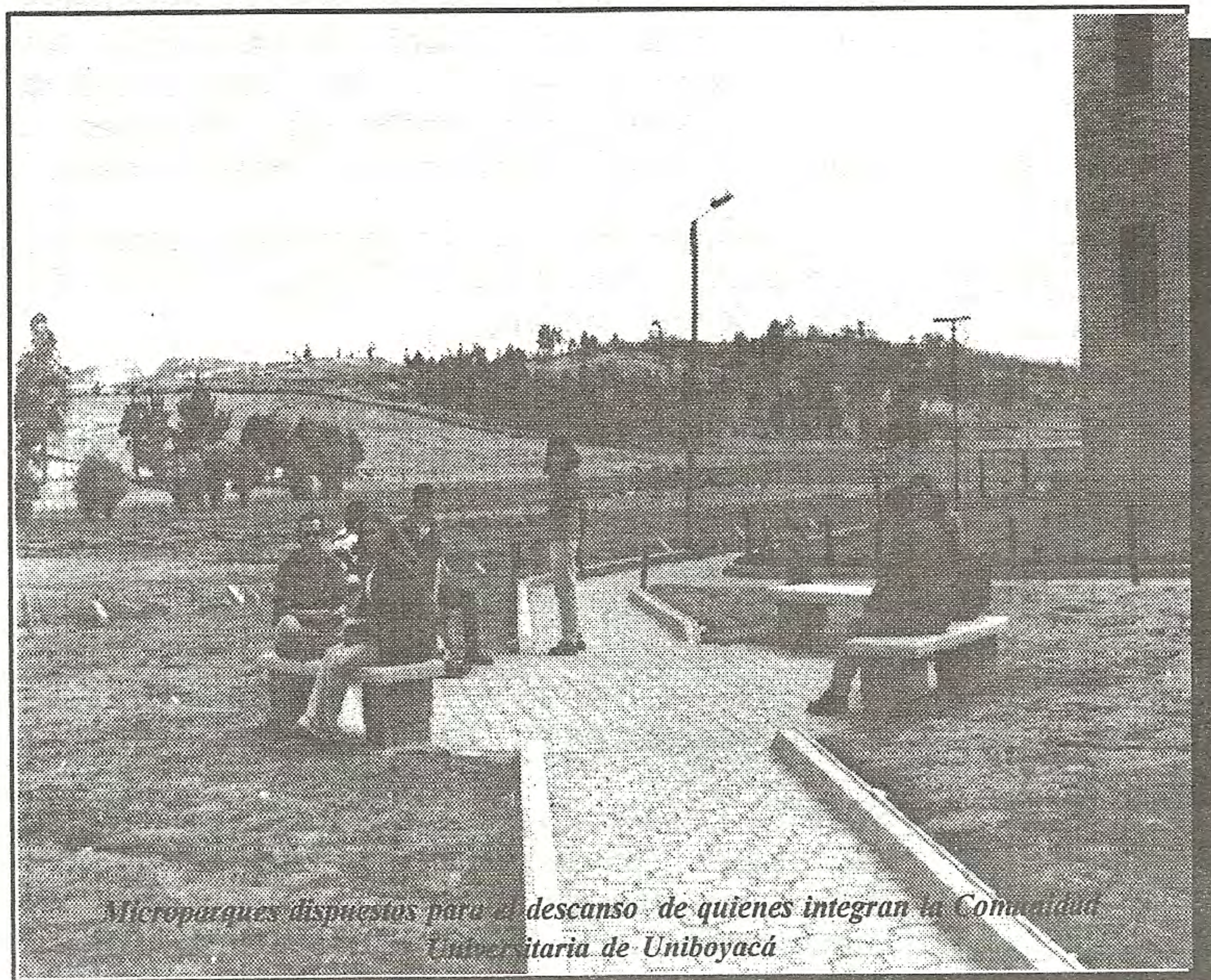
Microparques dispuestos para el descanso de quienes integran la Comunidad Universitaria de Uniboyacá