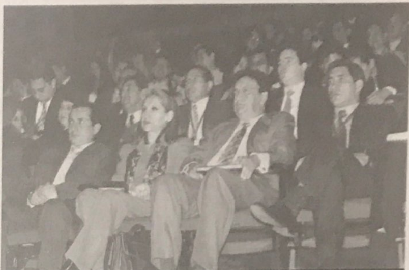
Más de 400 profesores de tiempo completo y cátedra de UniBoyacá participan en el Programa Permanente de Capacitación Docente.