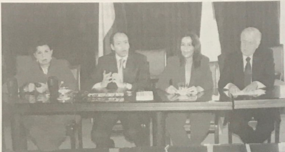
Con gran expectativa la Comunidad Académica fue testigo de la presentación pública del programa de educación virtual iniciado por UniBoyacá.

En el propósito de ampliar las opciones de cooperación universitaria con diversas instituciones mundiales y ofrecer mayores posibilidades de flexibilización académica para el Departamento de Boyacá y del país, UniBoyacá inició un trascendental y estratégico programa de educación virtual que fortalecerá la actividad académica e investigativa presencial, al tiempo que permitirá el ofrecimiento de nuevos Programas de pregrado y postgrado (Maestrías) a través del sistema de Universidad Virtual. Para realizar este Programa nuestra Universidad realizó un contacto con la Universidad Tecnológica Metropolitana de Chile (UTEM)