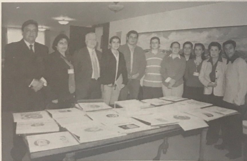
Integrantes del Jurado Calificador que seleccionó la propuesta ganadora para cambiar el logo-símbolo que identificará a UniBoyacá.