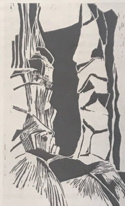
Estalagmita - Xilografía Autora Veronica Vargas

Recuerdo que la primera impresión que tuve al llegar a Tunja después de un largo