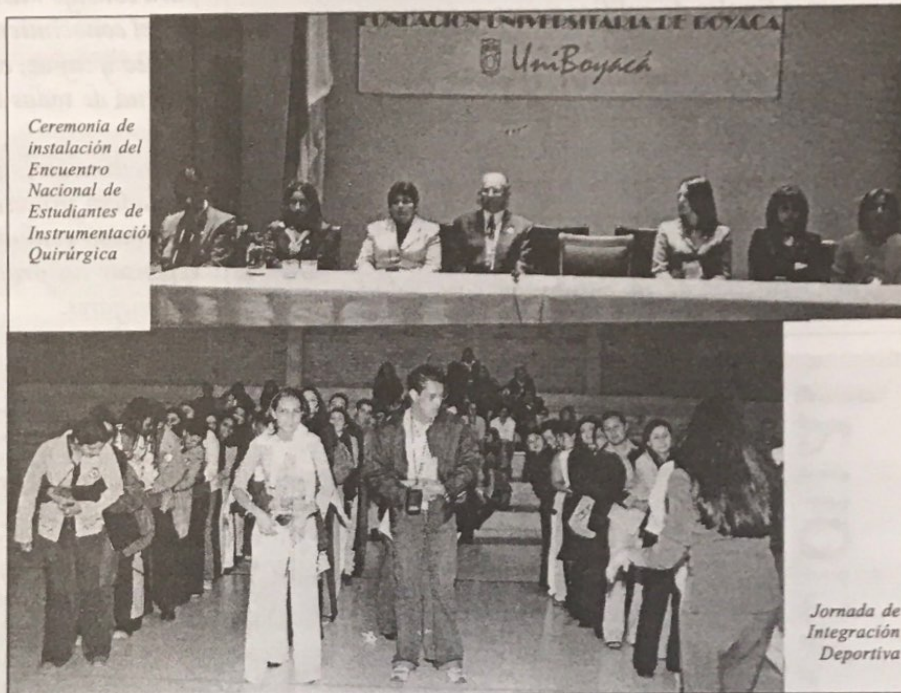
Ceremonia de instalación del Encuentro Nacional de Estudiantes de Instrumentación Quirúrgica

El Encuentro Nacional, que tuvo lugar en el paraninfo de UniBoyacá durante los días 10 y 11 de octubre, abordó el análisis de temas como el campo ocupacional para el profesional en instrumentación quirúrgica, los sustitutos óseos, el procesador digital de imágenes ecográficas como herramientas para el diagnóstico de patologías quirúrgicas, la construcción de conocimiento a partir de la investigación, el presente y el futuro de la monitorización de los procesos de esterilización, politraumatismo facial, Ley 784 de 2002, aplicación de la ergonomía en salas de cirugía; diseño, construcción e implementación de un calentador de líquidos quirúrgicos, programa interactivo sobre reconstrucción mamaria con recto anterior del