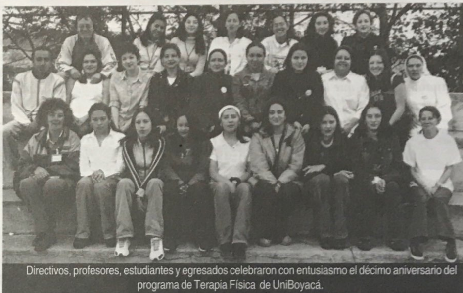
Directivos, profesores, estudiantes y egresados celebraron con entusiasmo el décimo aniversario del programa de Terapia Física de UniBoyacá.

A partir de las 2:00 p.m., se presentaron diversos grupos musicales de la institución que amenizaron los concursos y juegos realizados en las canchas deportivas y que se convirtieron en el punto de partida para la caravana multicolor que partió del campus universitario a las 5:00 p.m y recorrió las calles de la ciudad.