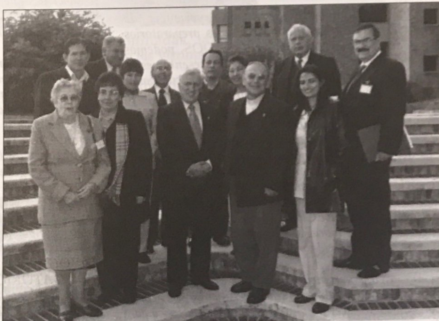
Rectores de las más importantes Instituciones de Educación Superior del País participaron en la Asamblea Anual de la ACIUP realizado en UniBoyacá.