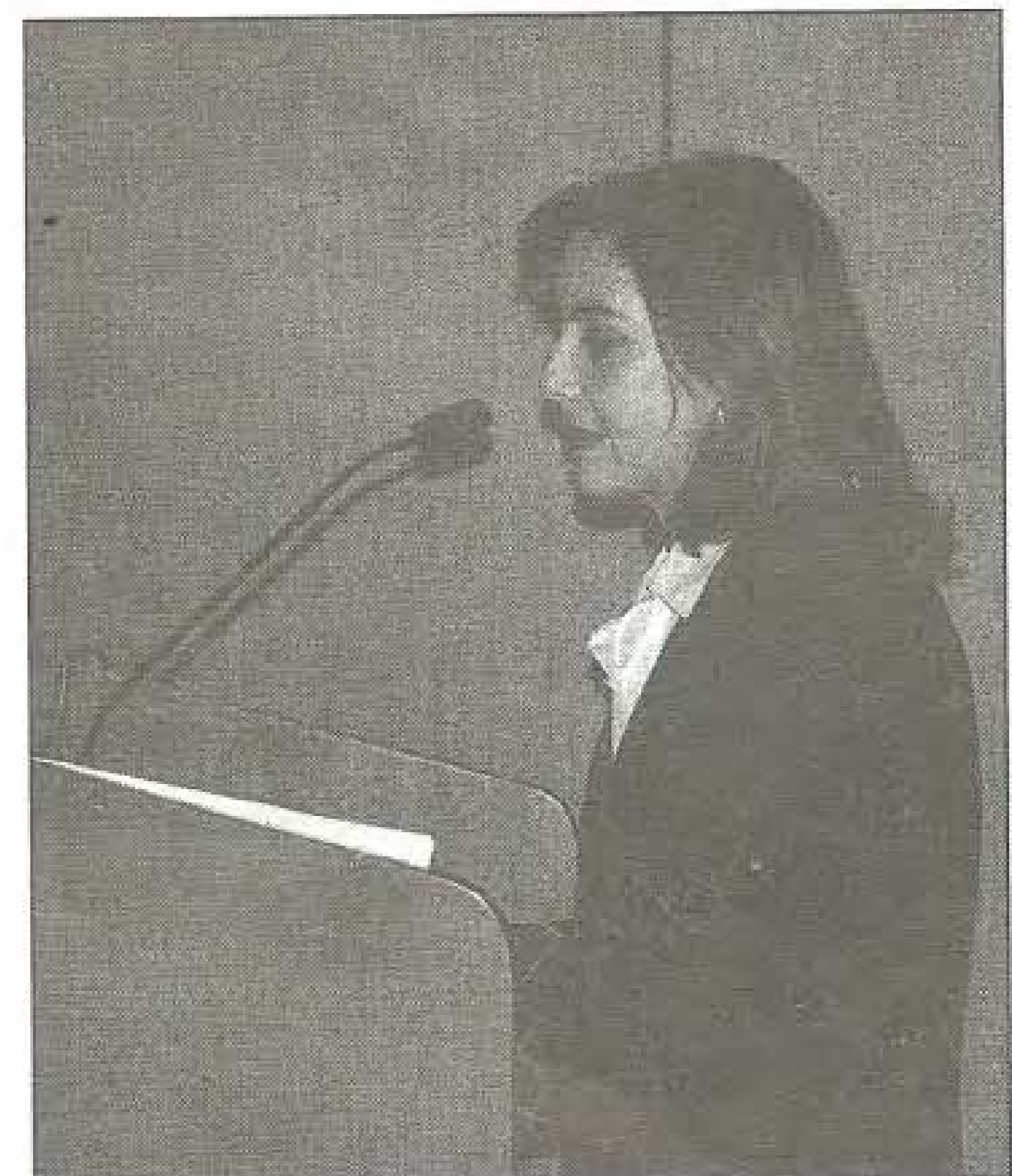
La exministra Gina Magnolia Riaño, durante la conferencia: Evaluación del Sistema de Seguridad Social en Colombia.

El convenio de cooperación académica contribuirá a establecer vínculos institucionales con el fin de colaborar en el desarrollo y progreso de los conocimientos en materia de salud y seguridad social, a través de un esfuerzo conjunto, intercambio académico e investiga, que involucre la formación de recurso humano en el área de seguridad social, economía y gestión de la salud.