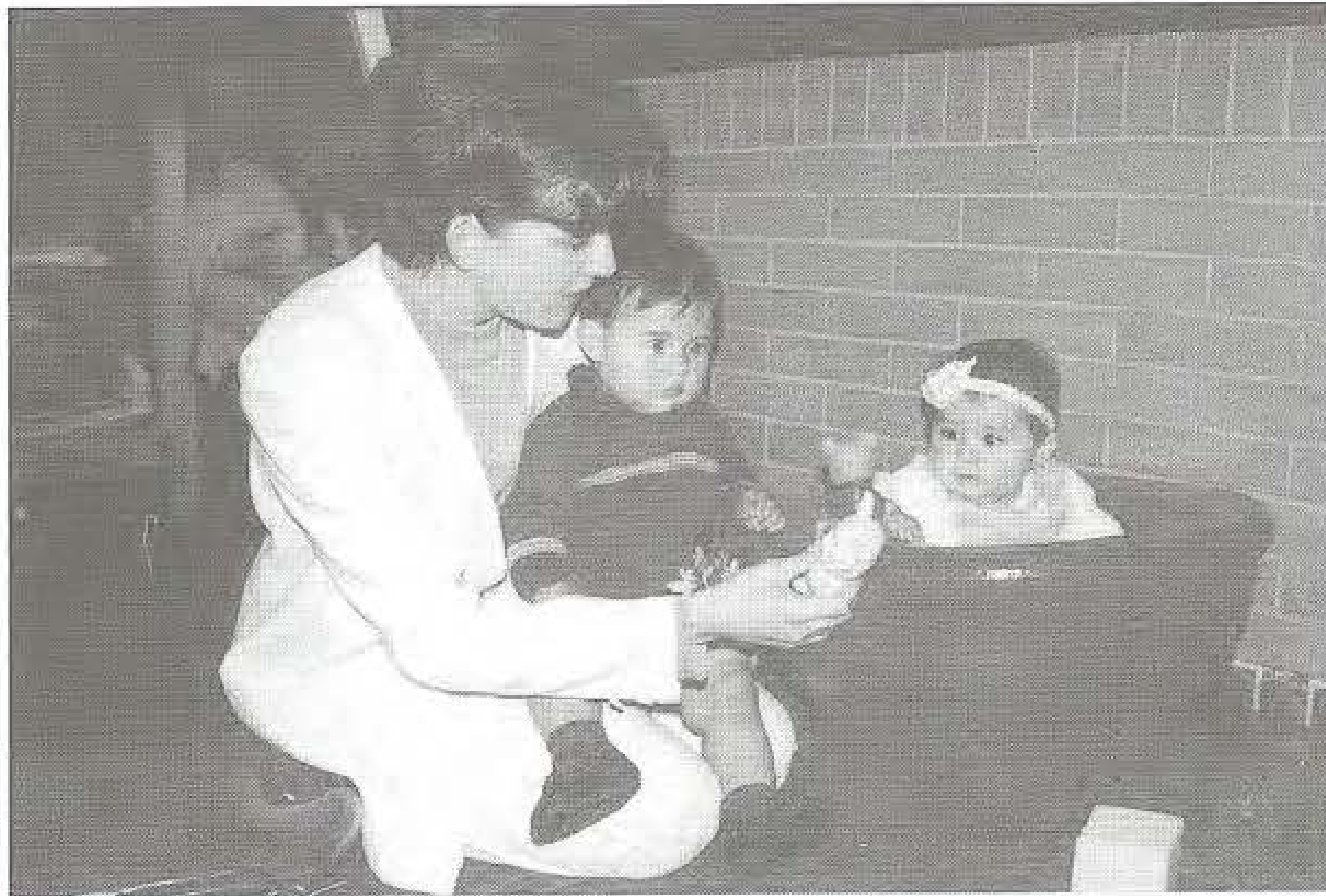
Práctica de estimulación adecuada

El Consultorio de Terapia Física adscrito a la Facultad de Ciencias de la Salud, propende por una atención eficaz y eficiente, fundamentada en la responsabilidad, idoneidad y ética profesional, dispuesto para el servicio del personal interno y externo a UniBoyacá. Además tiene como propósito contribuir a la formación integral del estudiante bajo los principios de criticidad y compromiso social que requiere el quehacer del Terapeuta Físico.