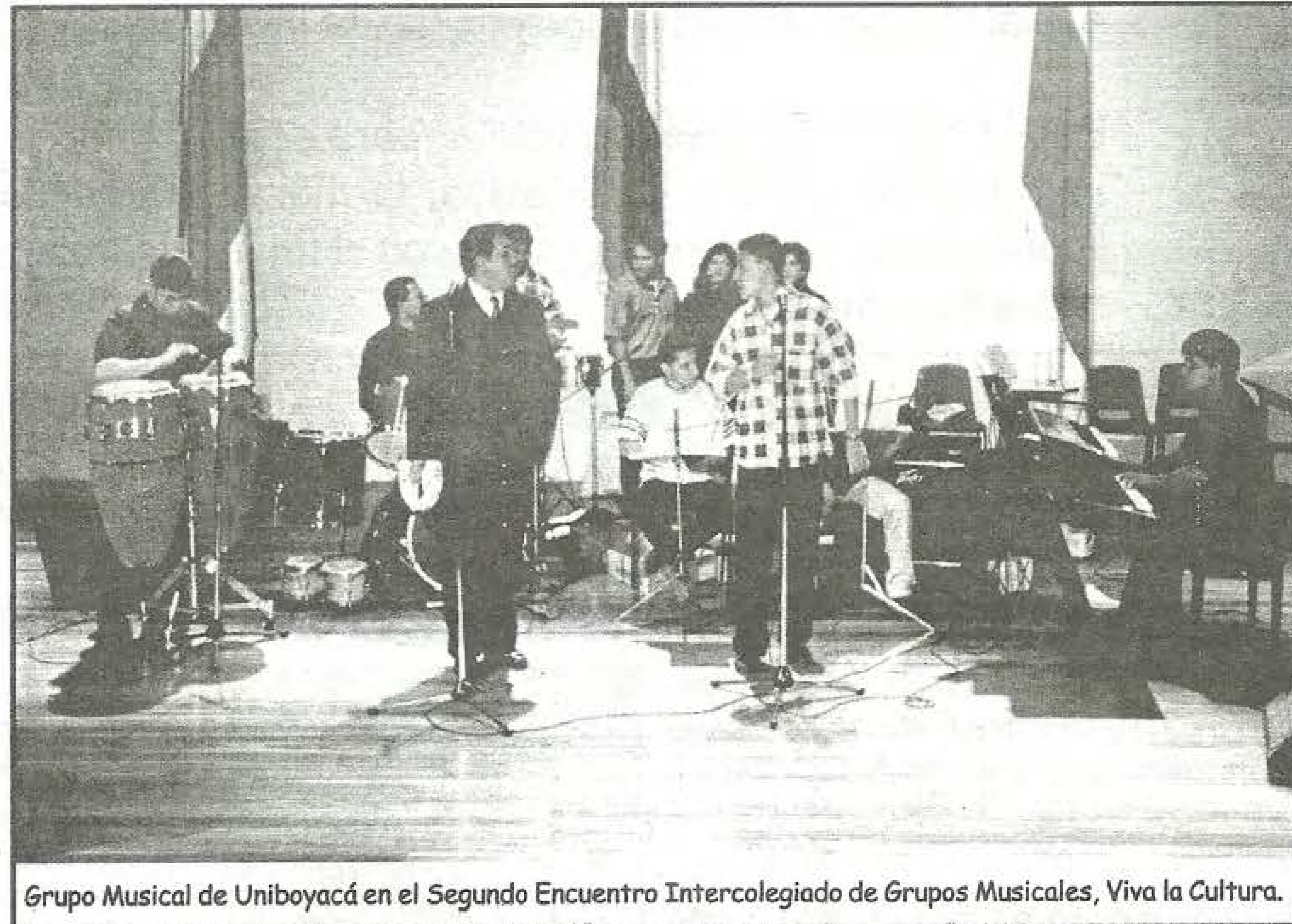
Grupo Musical de Uniboyacá en el Segundo Encuentro Intercolegiado de Grupos Musicales, Viva la Cultura.

El grupo de música de UNIBOYACÁ también se hizo partícipe en este encuentro cultural donde los asistentes tuvieron la oportunidad de disfrutar un variado repertorio de música colombiana, latin jazz, rock y latinoamericana.