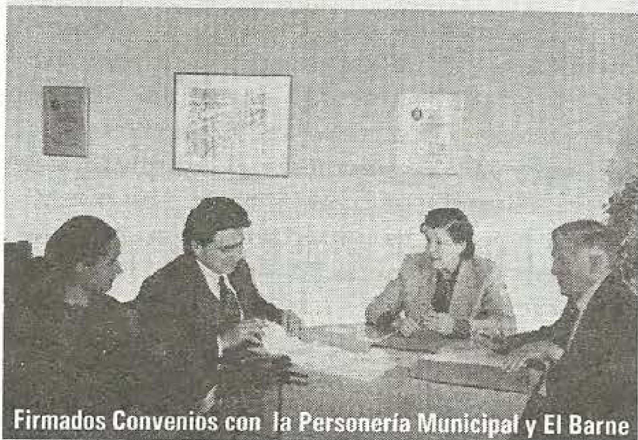
Firmados Convenios con la Personería Municipal y El Barne

Estos convenios permiten a los estudiantes de Consultorio Jurídico incrementar sus conocimientos en las áreas jurídicas que manejan estas entidades, a través de la práctica real que favorece la prestación del servicio, la solidaridad y la cooperación como bases del desarrollo social.