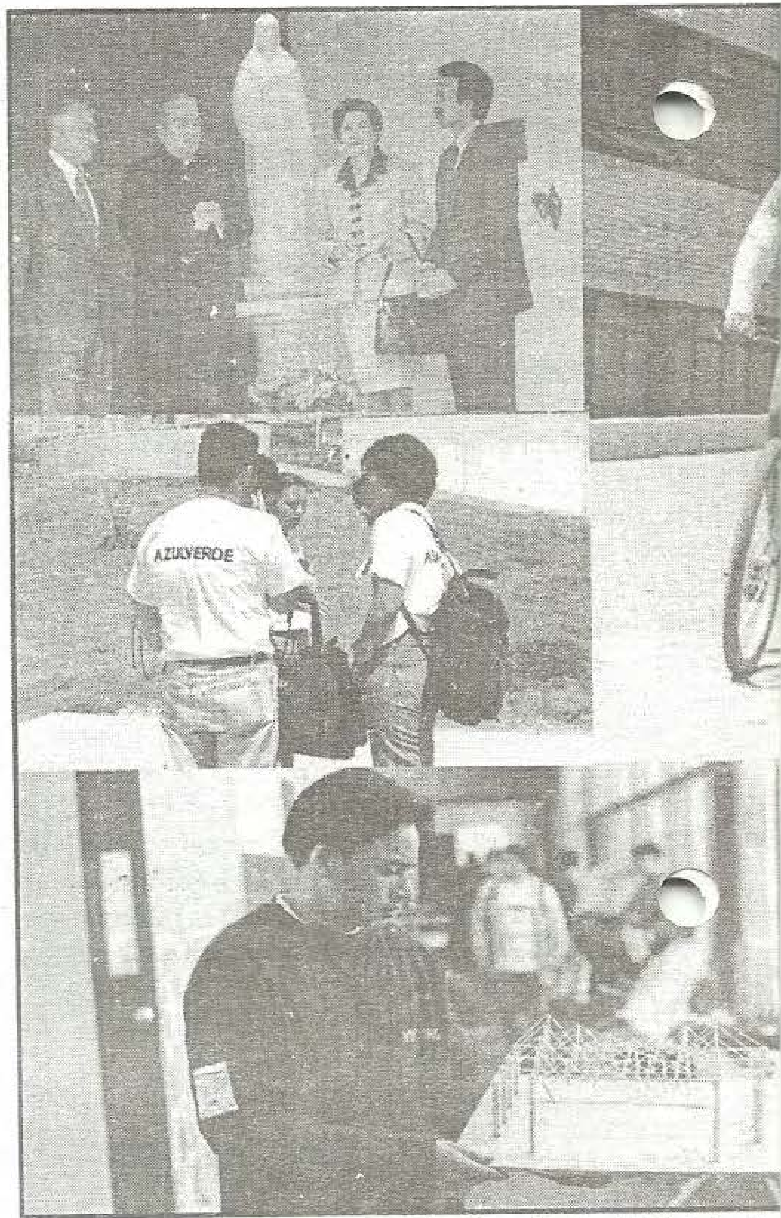
Imágenes de las Diferentes Actividades realizadas del 29 de Septier

La vinculación de la comunidad académica a esta efemérides fue la demostración más clara del alto sentido de pertenencia y del cariño que le profesamos a nuestra Universidad. Desde el 29 de septiembre y hasta el 05 de octubre la gran familia de UNIBOYACÁ se congregó