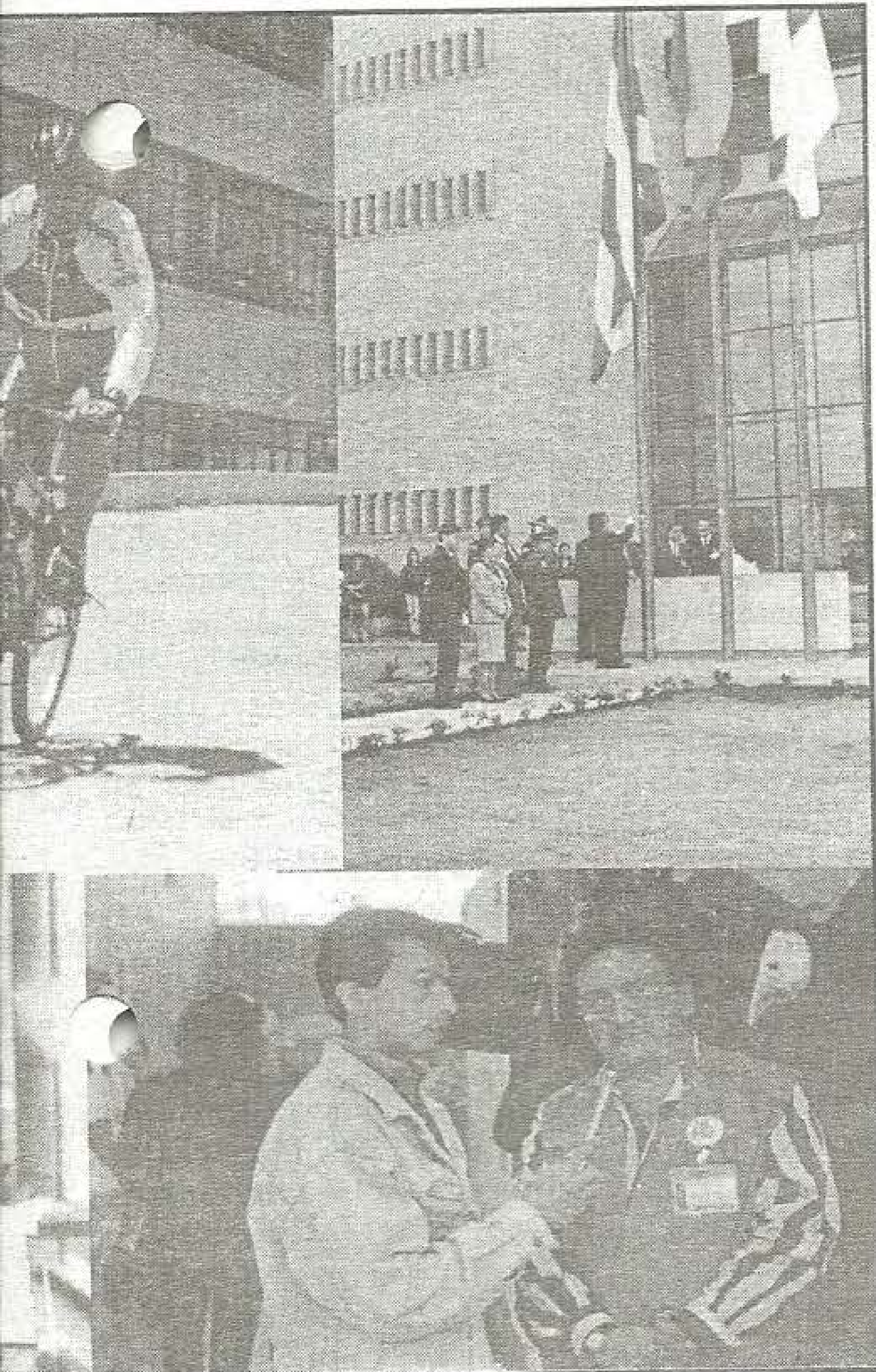
del 5 de Septiembre al 5 de Octubre, con motivo del XVIII Aniversario de Uniboyacá

En el ámbito cultural la Universidad demostró su poder de creación y convocación. La realización del "XV Salón de Artistas" fue el espacio propicio para la recreación visual de