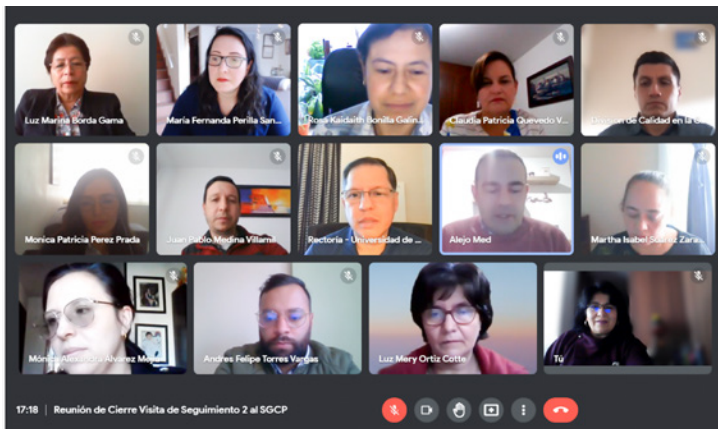
Reunión de cierre de la auditoría

Durante los días 28 y 29 de junio del presente año, la Universidad de Boyacá recibió la visita de auditoría al Sistema de Gestión de Calidad de Procesos por parte de Bureau Veritas, haciendo seguimiento a la vigente certificación de calidad en la norma ISO 9001:2015, otorgada a la "Prestación de Servicios de Educación Superior, Diseño y Desarrollo de Programas Académicos para Pregrado y Postgrado en sus modalidades Presencial y Virtual, desarrollo de proyectos de Investigación y fortalecimiento de la competencia Investigativa, bajo los lineamientos de la Gestión de Direccionamiento Estratégico y apoyados en las actividades desarrolladas por: Gestión de Admisiones y Matrículas, Gestión de Bienestar Universitario, Gestión de Recursos Bibliográficos, Gestión de Recursos Tecnológicos, Gestión de Comunicaciones y Mercadeo, Gestión de Calidad, Gestión de Relaciones Interinstitucionales, Gestión de Recursos Físicos, Gestión de Recursos Humanos y Gestión de Infraestructura Física"; demostrando un excelente desempeño que dejó como resultado conformidad total con los requisitos normativos, destacando el uso de las TICS como herramientas para el mejoramiento continuo y la capacidad de adaptación a los cambios importantes que ha presentado la sociedad durante el último año a causa del COVID-19.