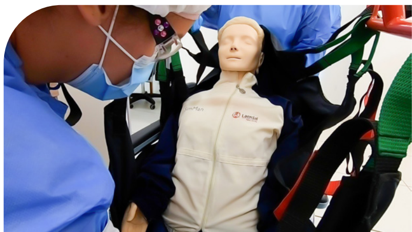
Manejo y traslado de paciente

Con este importante recurso formativo, único en la región, la Universidad de Boyacá sigue siendo pionera en la implementación de tecnologías educativas dispuestas para el fortalecimiento de la docencia, la investigación y la extensión, garantizando así el compromiso institucional con la alta calidad formativa y el desarrollo social.