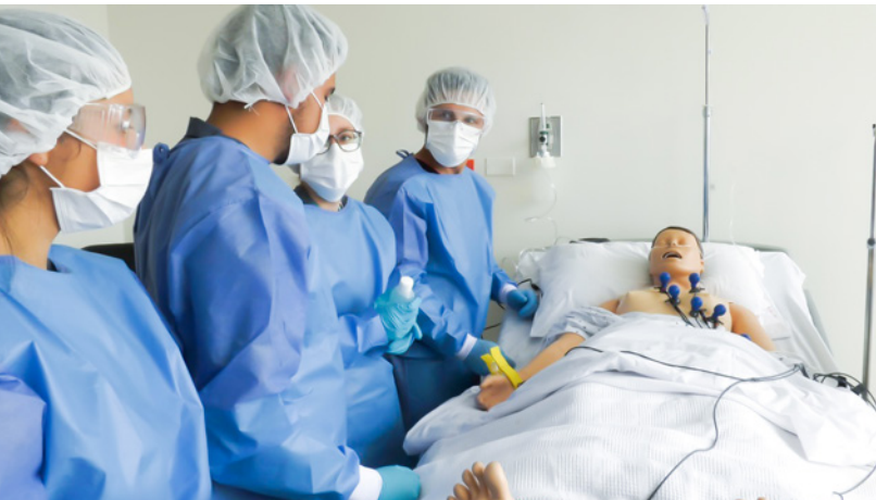
Electrocardiografía. Docentes y estudiantes durante práctica en Clínica de Simulación