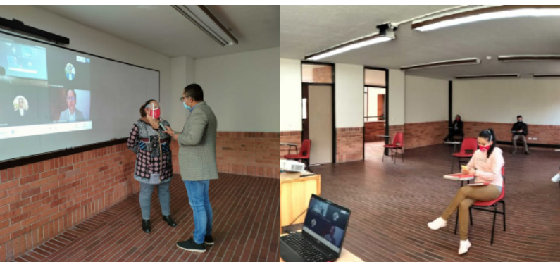
Pruebas piloto para alternancia en la Universidad de Boyacá

En concordancia con el llamado realizado por reconocidas instituciones internacionales como la Organización Mundial de la Salud (OMG) y la UNICEF, además de la solicitud del gobierno nacional, que señalan la necesidad y relevancia del retorno a las clases con alternancia en las entidades educativas, la Universidad de Boyacá viene sumando esfuerzos para garantizar la implementación de elementos de bioseguridad, movilidad, retorno a los laboratorios y por supuesto la actividad académica, teniendo presentes y acatando todas las consideraciones planteadas por el Ministerio de Salud Nacional para el retorno seguro a las actividades formativas.