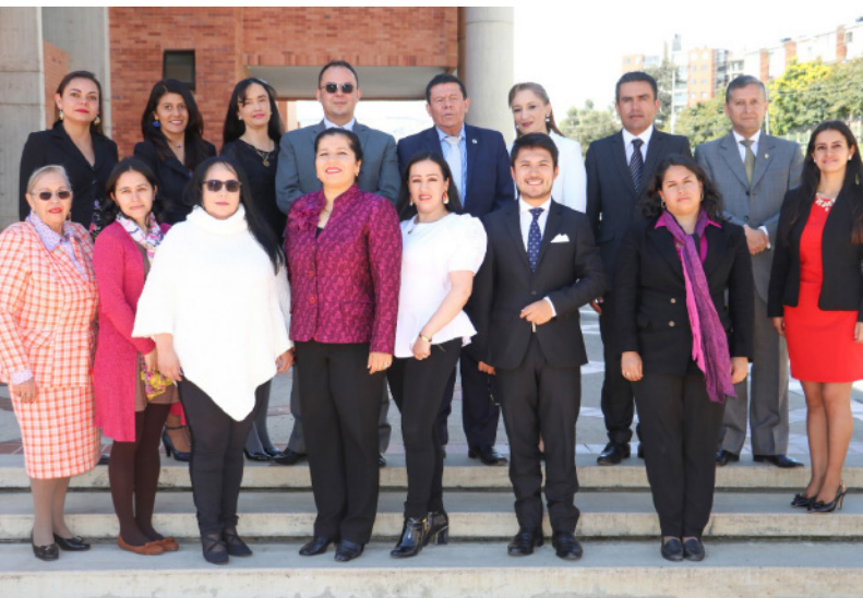
Grupo de docentes que participaron en este proceso (tomada en 2019)

Mediante Resolución No. 004291 de 12 de marzo del presente año el Ministerio de Educación Nacional (MEN), con base en el concepto del Consejo Nacional de Acreditación (CNA), otorgó la Acreditación Nacional en Alta Calidad por 4 años al programa de Derecho y Ciencias Políticas de la Universidad de Boyacá, programa pionero en el departamento y en el oriente colombiano que se ofrece en las sedes de Tunja y Sogamoso.