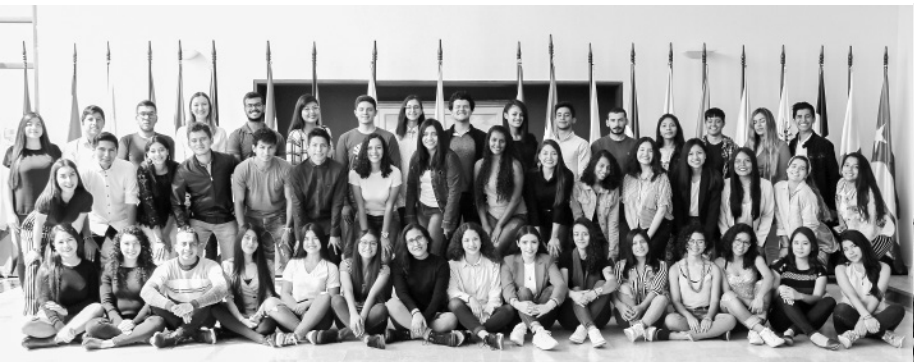
Estudiantes de intercambio movilidad entrante