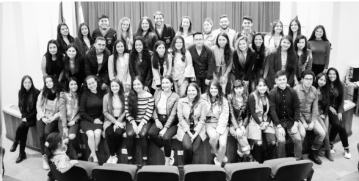
Estudiantes de intercambio movilidad saliente

La Universidad de Boyacá da la bienvenida a los nuevos estudiantes, quienes hacen parte de esta Alma Mater durante el presente semestre gracias a los procesos de movilidad nacional e internacional, programa que ha facilitado a cientos de alumnos de instituciones que tienen convenio de cooperación vigente con la Universidad de Boyacá, realizar un semestre de intercambio para adelantar prácticas profesionales, cursar semestres académicos o efectuar procesos de investigación, brindando herramientas que les permiten interactuar en otros escenarios dentro y fuera del país, enriqueciendo su proceso de formación.