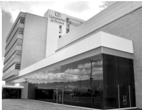
Edificio Campus Sogamoso