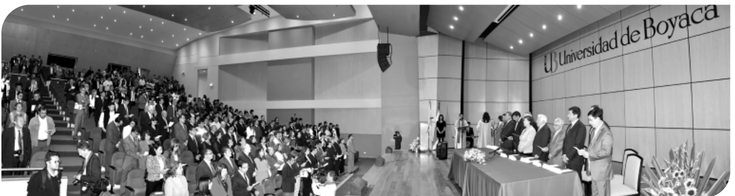
Paraninfo Sede Sogamoso en acto inaugural

Al final del evento las directivas de la Universidad de Boyacá reiteraron su compromiso con el oriente colombiano y el país, de seguir formando "los mejores profesionales, especialistas y magisteres", siempre ofreciendo las mejores condiciones y programas académicos, con la más alta calidad en su planta docente, que ha caracterizado a la institución durante estos 35 años de labores.