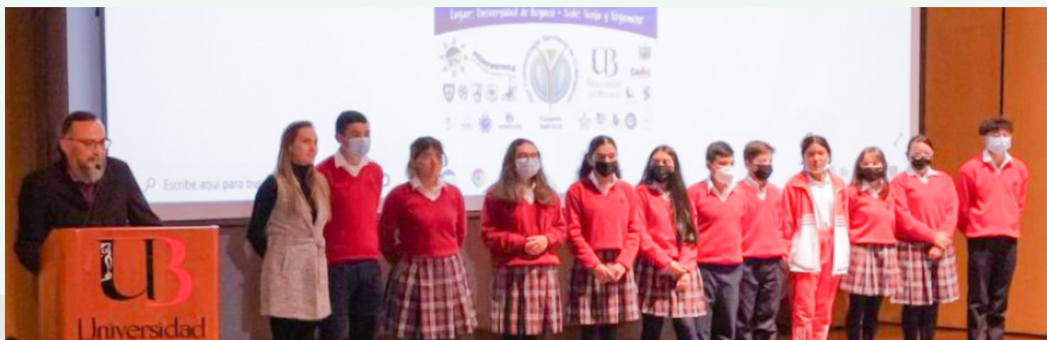
El Encuentro sirvió para el intercambio de saberes y experiencias entre los semilleros de los colegios y las instituciones de educación superior, con lo cual se fortalece la investigación formativa

Del 17 al 19 de mayo se desarrolló en las sedes de Tunja y Sogamoso de la Universidad de Boyacá el XIX Encuentro de Semilleros de Investigación - RedColSI nodo Boyacá. En el encuentro se presentaron 220 proyectos de colegios y universidades de la región, de los cuales 135 proyectos corresponden a la UdB. Las modalidades de participación fueron: propuestas de investigación, investigaciones en curso y culminadas. Los estudiantes y docentes participaron en