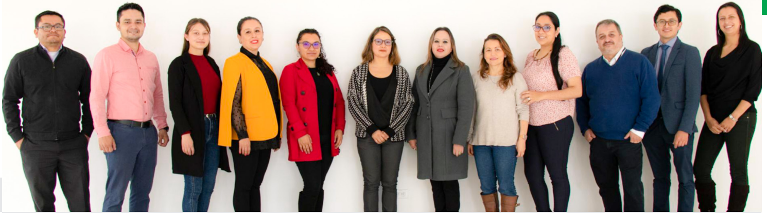
Grupo de investigación Núcleo

El Ministerio de Ciencia, Tecnología e Innovación de Colombia - Minciencias emitió el 24 de mayo de 2022 los resultados de la convocatoria nacional 894 para el reconocimiento y medición de grupos de investigación, desarrollo tecnológico o de innovación y para el reconocimiento de investigadores del Sistema Nacional de Ciencia, Tecnología e Innovación - SNCTI 2021. La Universidad de Boyacá obtuvo la recategorización de 18 grupos de investigación y de 82 investigadores, lo que refleja la alta calidad de la producción investigativa y el compromiso de los investigadores y directivos con esta función sustantiva de la Institución.