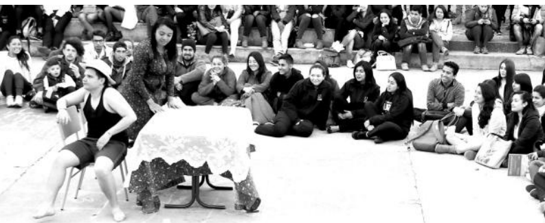
Estudiantes en el Décimo Encuentro de Inquietudes Juveniles

En el marco de la celebración de los 38 años de la Universidad de Boyacá, el día 5 de octubre del presente año, el Departamento de Ética y Humanidades realizó el décimo Encuentro de Inquietudes Juveniles que tuvo por nombre Cultura juvenil: rompiendo esquemas.