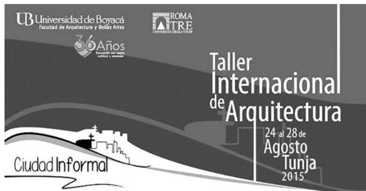
Imagen del Seminario Taller Internacional de Arquitectura Ciudad Informal

Igualmente, destacaron las propuestas diseñadas por los estudiantes, quienes enfatizaron en aspectos sociales de la zona de estudio y sus carencias como las identificadas en equipamientos, espacio público que garantice la calidad de vida y otros sistemas que permitan conectar la zona con el resto de la ciudad.