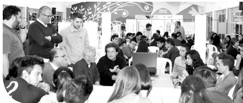
Estudiantes y docentes participantes en el Seminario Taller Internacional de Arquitectura Ciudad Informal