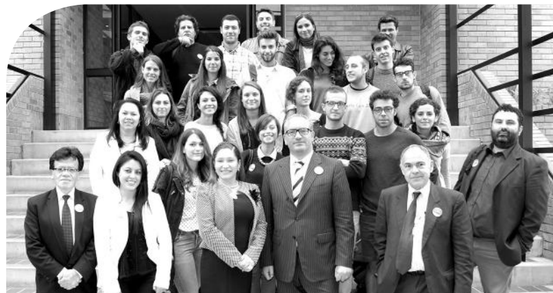
Participantes Seminario Taller Internacional de Arquitectura Ciudad Informal Universidad de Boyacá, Universidad Roma Tres de Italia