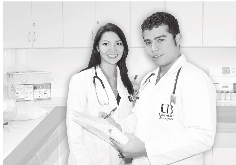
Estudiantes Programa de Medicina

La Universidad de Boyacá dentro de sus políticas de Desarrollo Administrativo y Financiero y en la proyección de su visión de “Ser los Mejores”, presenta a la comunidad académica un novedoso y avanzado sistema de realidad virtual denominado Cyber- Anatomy, un moderno software interactivo en 3D que se constituye en un excelente material de apoyo docente imprescindible en el proceso de enseñanza – aprendizaje de esta asignatura de las Ciencias Básicas, que cursan los estudiantes de los diferentes Programas de la Facultad de Ciencias de la Salud como Bacteriología y Laboratorio Clínico, Enfermería, Fisioterapia, Instrumentación Quirúrgica, Medicina y Terapia Respiratoria.