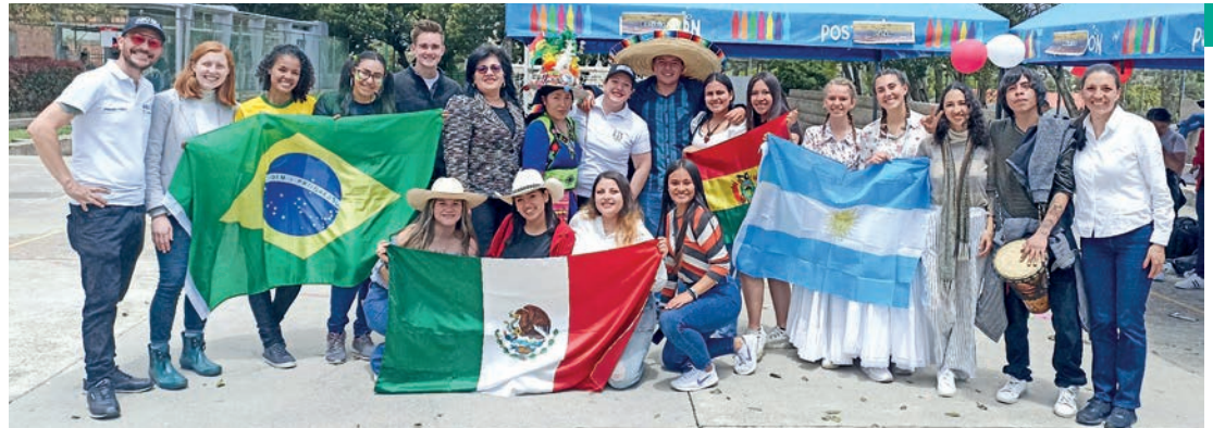
Directivos, docentes, estudiantes, administrativos y egresados se deleitaron con las muestras típicas de los países participantes, que fueron dignamente representados por estudiantes de intercambio y los asistentes de idiomas (Comisión Fulbright)

En el marco del cuadragésimo tercer aniversario de la Universidad de Boyacá, la División de Relaciones Interinstitucionales e Internacionales realizó el pasado 11 de octubre su tradicional Feria de Países en la sede Tunja. El objetivo de esta actividad fue seguir fortaleciendo la internacionalización en nuestra institución, acercando a la comunidad universitaria a la cultura de diferentes países.