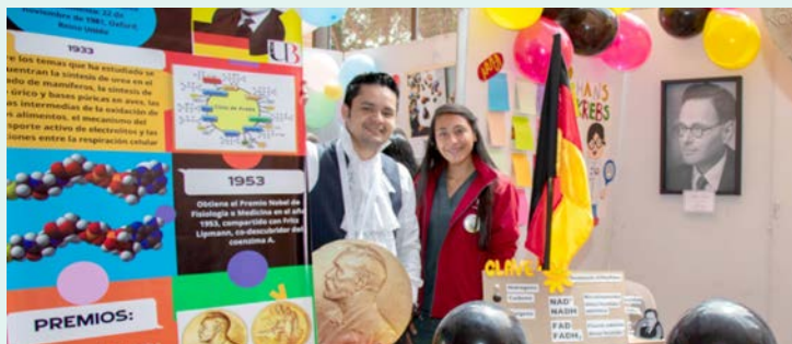
Los asistentes a esta exposición pudieron apreciar las principales épocas y avances de la química a través de diversas charlas y actividades lúdicas.

El pasado jueves 27 de octubre los estudiantes y docentes del Departamento de Química y Bioquímica, adscrito a la Facultad de Ciencias e Ingeniería, realizaron “Expociencia 2022: un viaje por la historia de la ciencia”, evento desarrollado en el Hall de Artes de la UdB en Tunja. En esta actividad se llevó a cabo una puesta en escena, a través de una línea de tiempo con los avances científicos más representativos desde la Edad Antigua hasta la química contemporánea. Cada una de las estaciones mostró la