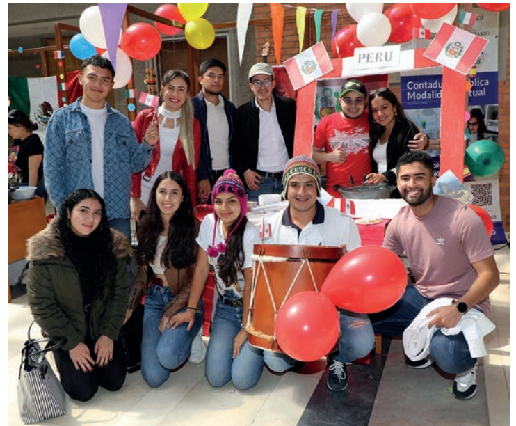
En la sede Sogamoso, estudiantes de intercambio compartieron experiencias culturales y presentaron a la comunidad universitaria muestras típicas de sus países

De la misma manera, los estudiantes de intercambio procedentes de Brasil y Perú deleitaron a los asistentes con alegres cantos y ritmos sudamericanos. Los estudiantes y funcionarios de la UdB también se integraron a la Feria con la presentación de los Grupos de Música Llanera, Vallenata y Andina. Adicionalmente, los asistentes que visitaron los stands de la Feria pudieron disfrutar de la gastronomía de los países invitados. El 19 de octubre la Feria de Países también se realizó en el hall de ingreso de la Universidad de Boyacá, sede Sogamoso, en donde se dieron cita estudiantes de intercambio de Argentina, México, Brasil y Bolivia, con el propósito de compartir sus experiencias culturales y de intercambio. La actividad fue apoyada por las directivas de la sede Sogamoso y contó con la masiva participación de docentes, estudiantes, personal administrativo y egresados.