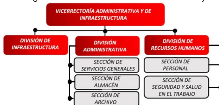
Figura 2. Estructura Organizacional Vicerrectoría Administrativa y de Infraestructura