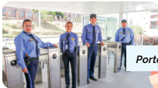
Portería peatonal principal occidental.