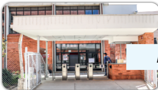
Portería sur edificios 9, 10 y 12.