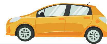
Portería vehicular norte.