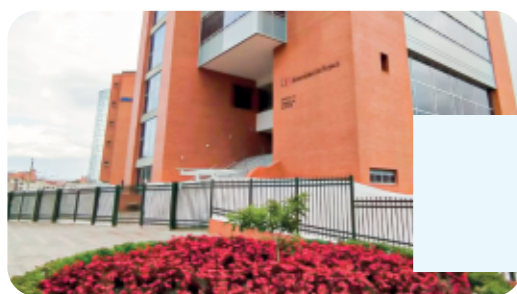
Portería occidental edificio 12 exclusivamente para salida.