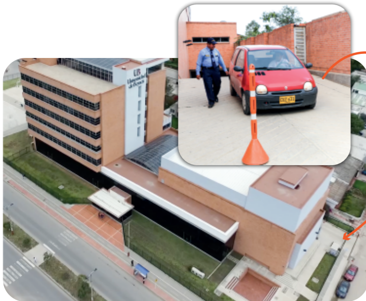
Portería vehicular edificio 1

Estarán habilitadas las siguientes entradas al campus universitario , con el fin de garantizar el adecuado control de las condiciones de salud al momento del ingreso y el seguimiento al procedimiento de desinfección requerido