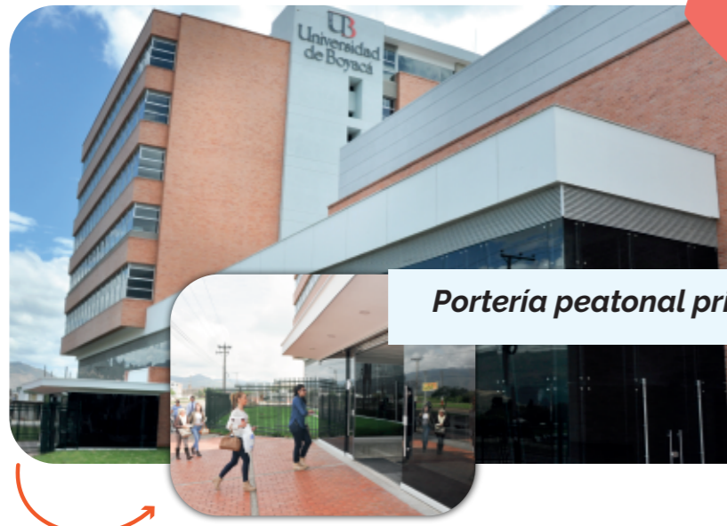
Portería peatonal principal edificio 1