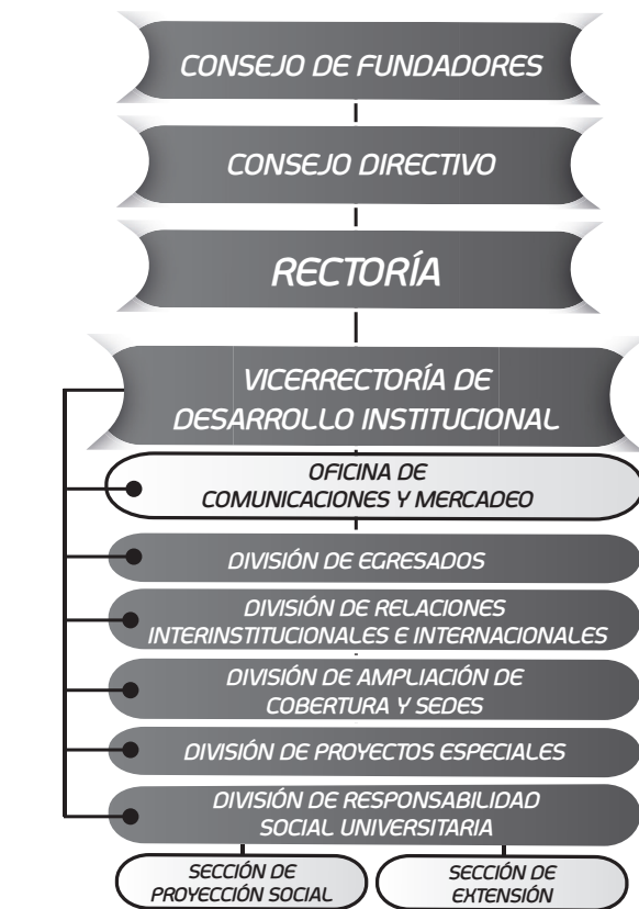
Figura 1. Estructura organizacional de la Vicerrectoría de Desarrollo Institucional