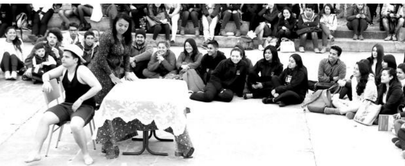
Estudiantes en el Décimo Encuentro de Inquietudes Juveniles

En el marco de la celebración de los 38 años de la Universidad de Boyacá, el día 5 de octubre del presente año, el Departamento de Ética y Humanidades realizó el décimo Encuentro de Inquietudes Juveniles que tuvo por nombre Cultura juvenil: rompiendo esquemas.