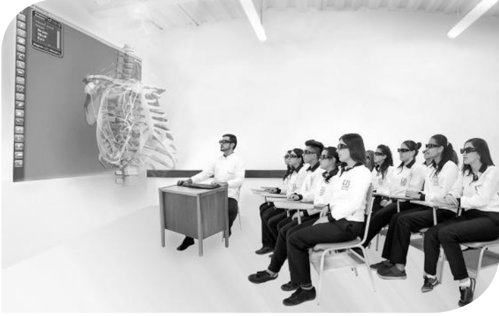
Una de las fotografías enviadas para concurso