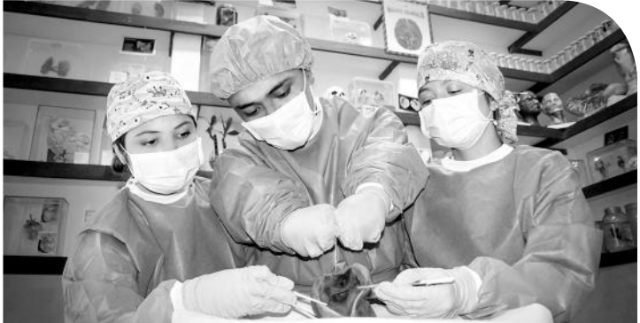
Una de las fotografías enviada para concurso