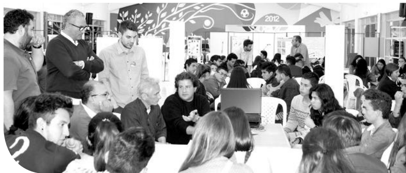
Estudiantes y docentes participantes en el Seminario Taller Internacional de Arquitectura Ciudad Informal